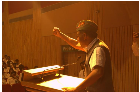
Glimpse/s of the event